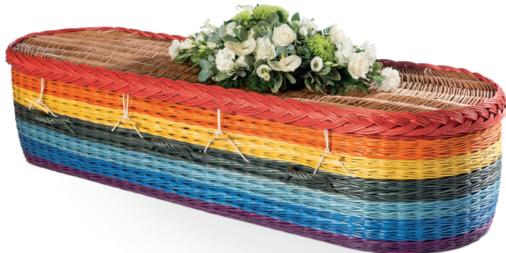
De "Regenboog" uitvaartmand