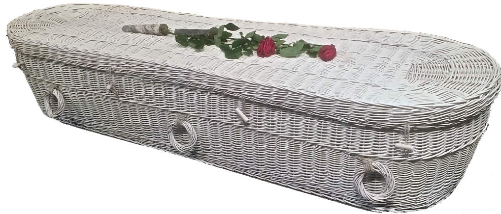
Wilgenteen Cromer Rond Wit