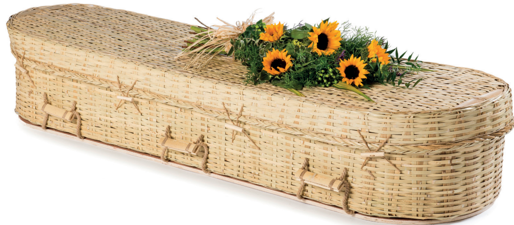
Bamboe Eco Rond