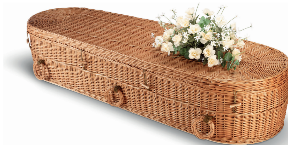
Wilgenteen Cromer Rond