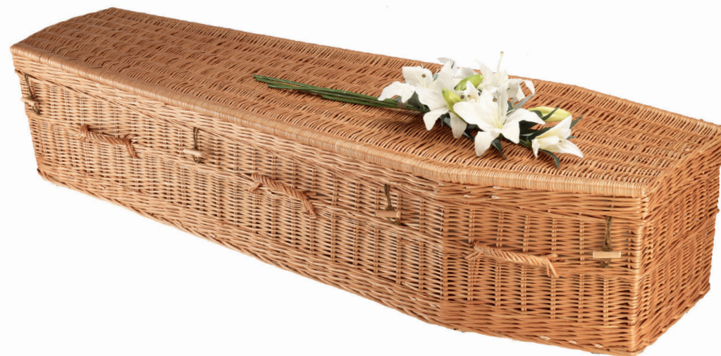
Wilgenteen Highsted Traditioneel