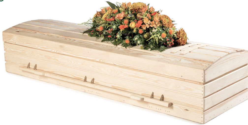
Pine Eco Casket