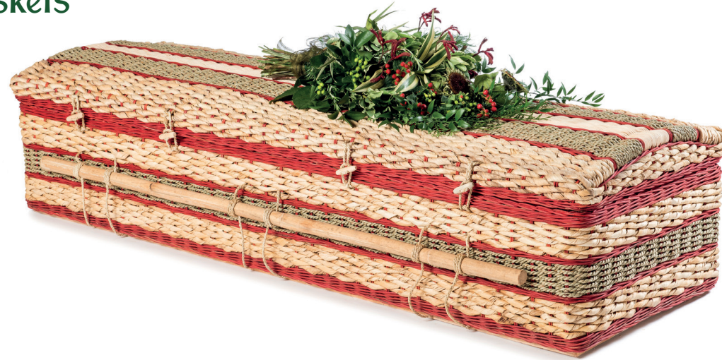
Bananenblad Casket Cerise