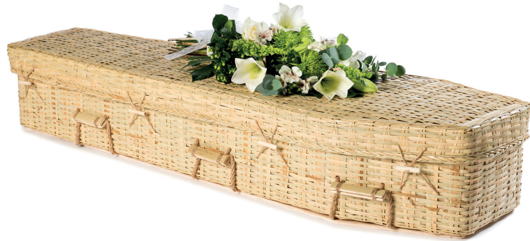
Bamboe Eco Traditioneel