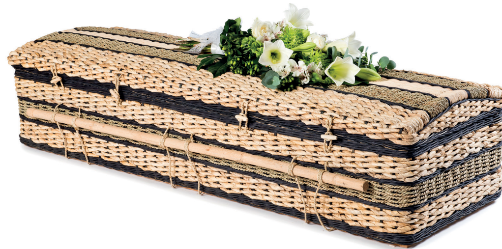
Bananenblad Casket Ebony